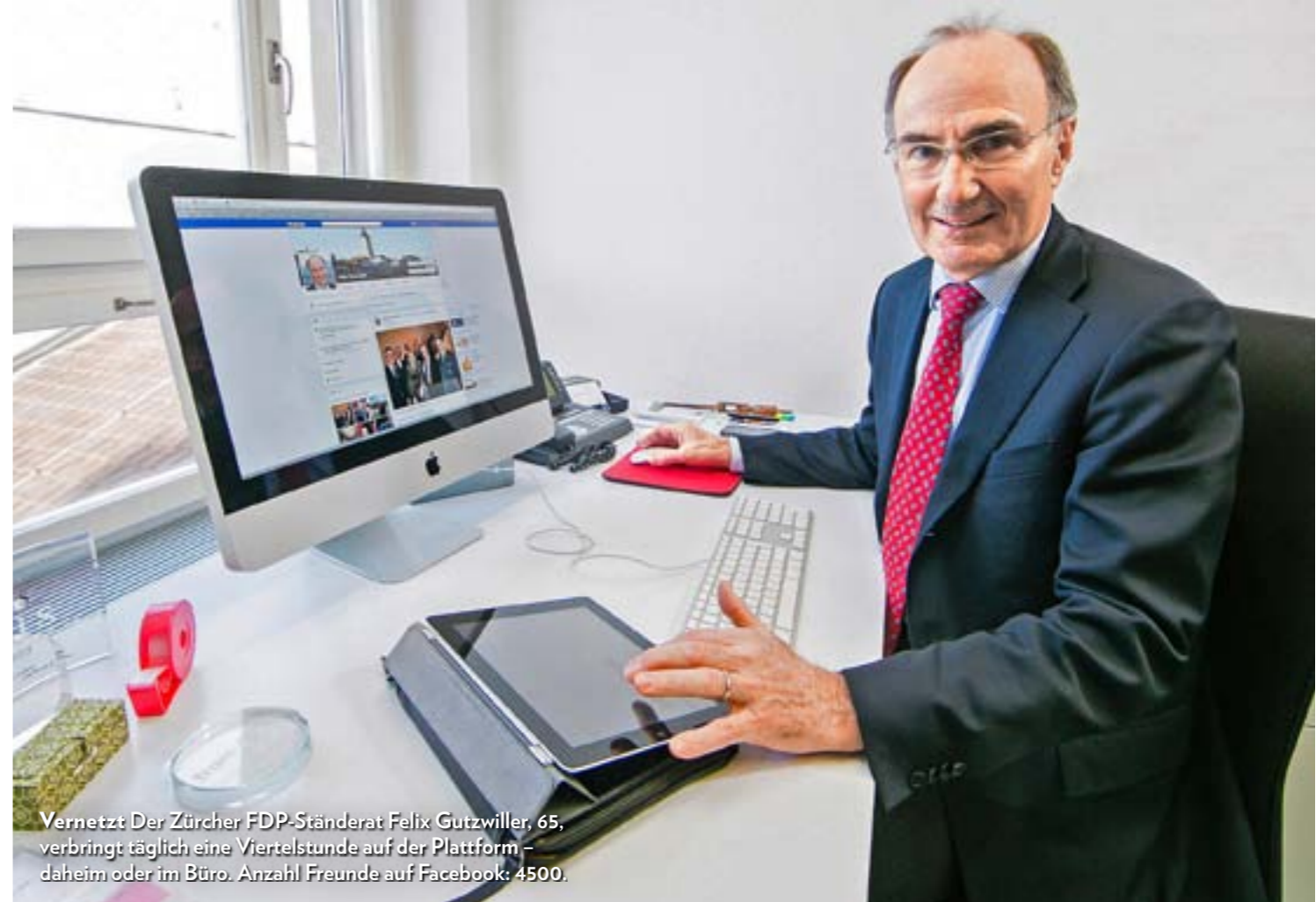
Vernetzt Der Zürcher FDP-Ständerat Felix Gutzwiller, 65, verbringt täglich eine Viertelstunde auf der Plattform – daheim oder im Büro. Anzahl Freunde auf Facebook: 4500.